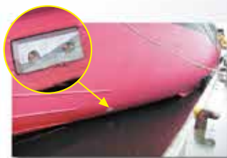
船舶（タンカー）の外板