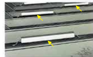
船舶（タンカー）のバラストタンク