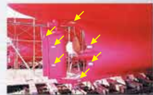
船舶の外板（スクリュー近辺）