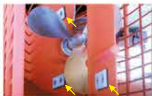
船舶の外板（スクリュー近辺）